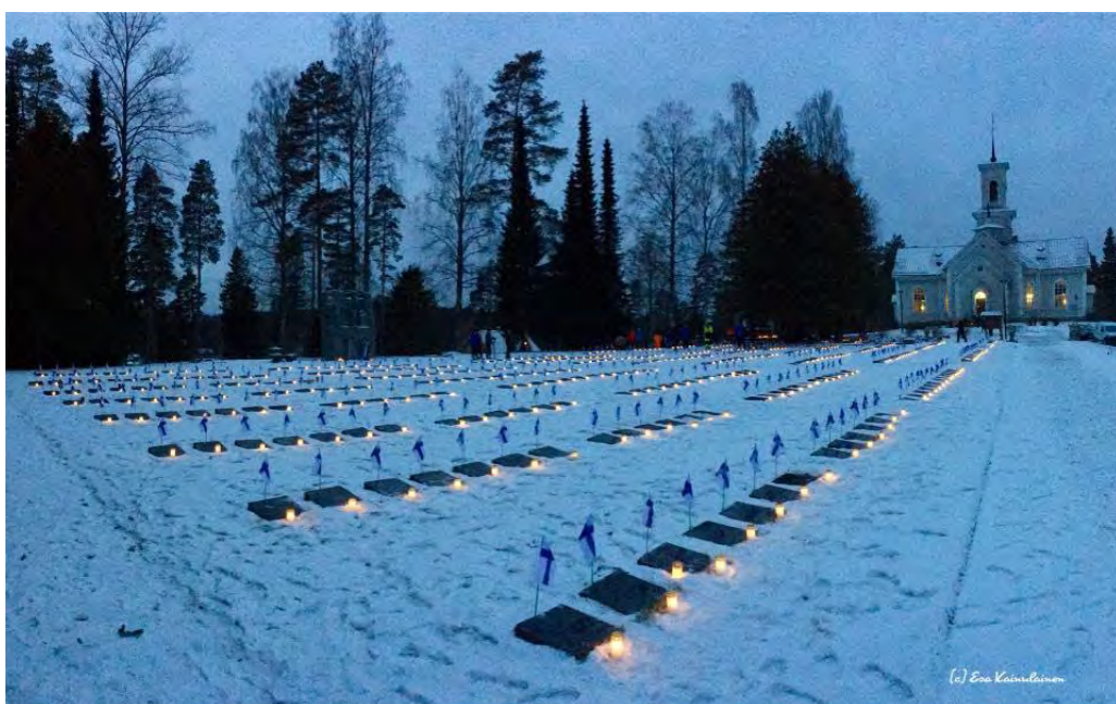
Viitasaaren sankarihautausmaa 6.12.2017