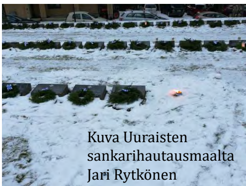
Kuva Uuraisten sankarihautausmaalta Jari Rytönen