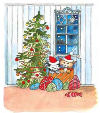
Joulun iloisia yllätyksiä