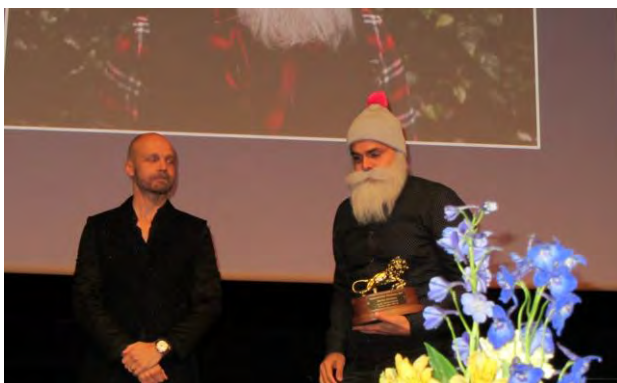
Juha Tapio ja Brother Christmas